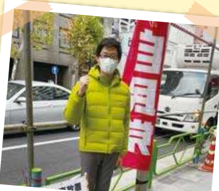
朝の定例挨拶 (人形町交差点)