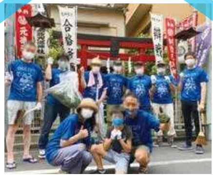
東京2020大会 おもてなし清掃 (浜町 元徳神社前)