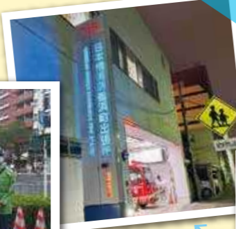
◎日本橋消防団 での活動