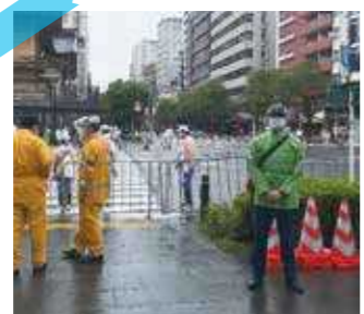
東京2020大会 沿道警備