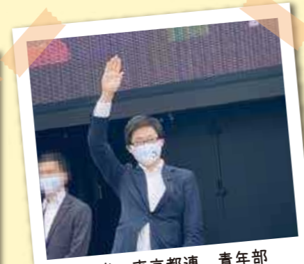
自民党 東京都連 青年部 一斉街頭 (上野駅前)